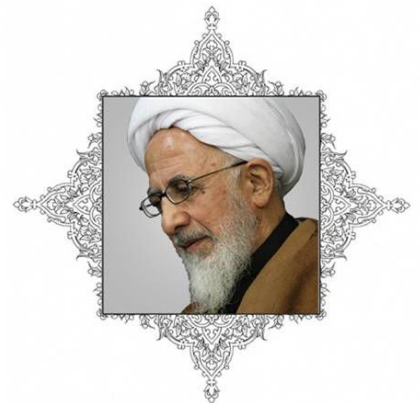
آیت الله عبدالله جوادی آملی

این مرجع تقلید با اشاره به نگارش کتاب «فاطمه زهرا، برترین بانوی عالم» عنوان کرد: در فکر بودیم که ۴۰ حدیث از منابع اهل سنت در مورد فضائل حضرت زهرا جمع آوری کنیم دیدیم خیلی از این احادیث با منابع شیعه هماهنگ است لذا امیدوارم مردم توجه کنند در شرایطی که انسجام همه مسلمانان در مقابل دشمن لازم است، این انسجام را به هم نزنند.